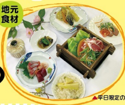
▲平日限定の夕食です