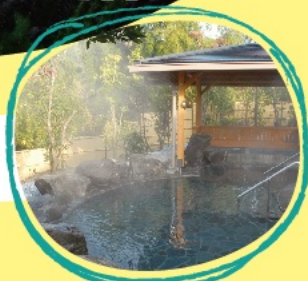
▲別館 源じいの森温泉 露天風呂